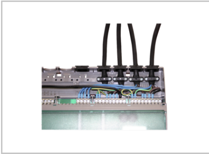
Zugentlastungsset für AP-Gehäuse 1002236