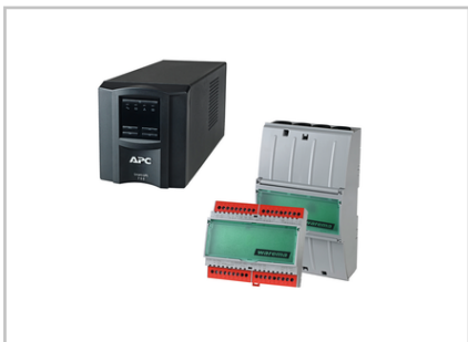
Schlüsseltaster Notstrom-Kit AP 1-polig 2017192