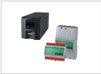
Wand-/Deckenhalterset Notstrom-Kit 2031735