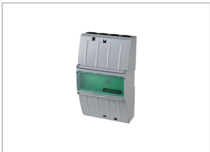
Schaltnetzteil 24 V DC / 2,5 A AP 2024681