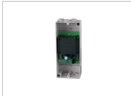
Netzteil 24 V DC / 1,0 A AP 629054