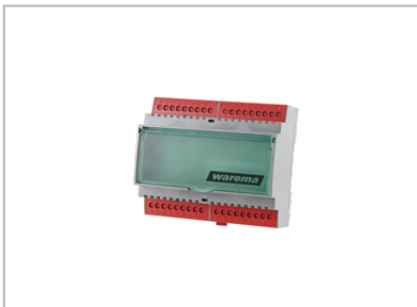
Schaltnetzteil 24 V DC / 2,5 A REG 2024680