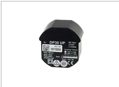
Schaltnetzteil 24 V DC, 1,25 A UP 2016370