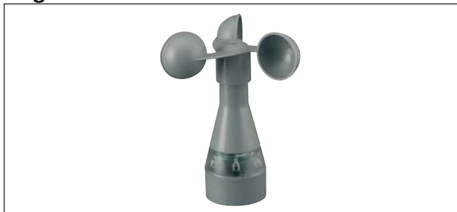
Abb. 1 Messwertgeber Wind/Photo (180°)

Der Messwertgeber wird an eine Sonnenschutzzentrale (z.B. Minitronic) angeschlossen und ermöglicht wind- bzw. lichtabhängige Steuerung von Sonnenschutzprodukten wie Markisen oder Raffstoren. Der Messwertgeber wird mit einem Befestigungswinkel im Außenbereich montiert.