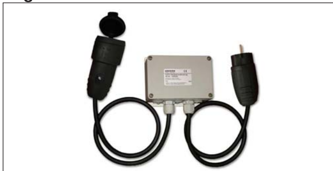
Abb. 1 EWFS Heizstrahlersteuerung

Die EWFS Heizstrahlersteuerung ermöglicht die einfache und kostengünstige Nachrüstung einer drahtlosen Fernbedienung für den WAREMA Heizstrahler. Hierzu sind geringfügige Elektro-Installationsarbeiten notwendig. Die EWFS Heizstrahlersteuerung kann Schaltbefehle von EWFS-kompatiblen Sendern, z.B. Funk-Handsender (1- und 8-Kanal) empfangen.