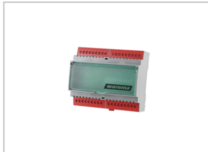
Schaltnetzteil 24 V DC / 2,5 A REG 2024680