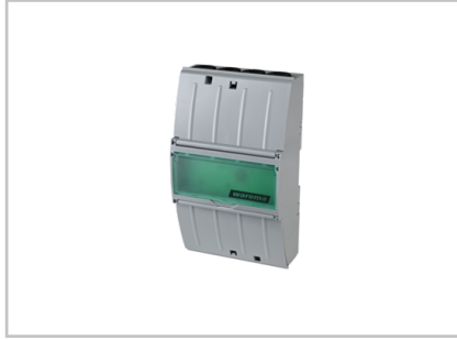
Schaltnetzteil 24 V DC / 2,5 A AP 2024681