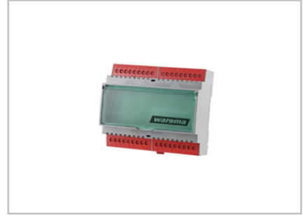
Schaltnetzteil 24 V DC / 2,5 A REG 2024680